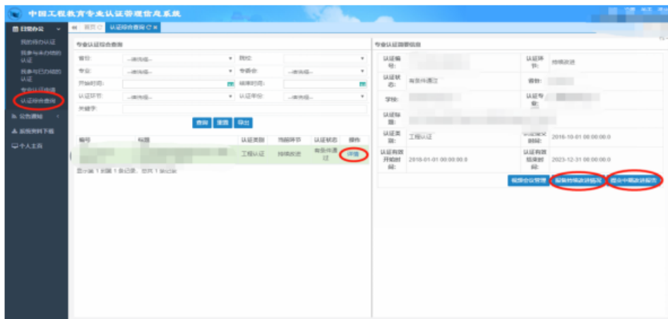
图 3“填写专业联系人信息”界面

“日常办公”->“认证综合查询”->“详情”->“修改联系人信息”，如图 3 所示：