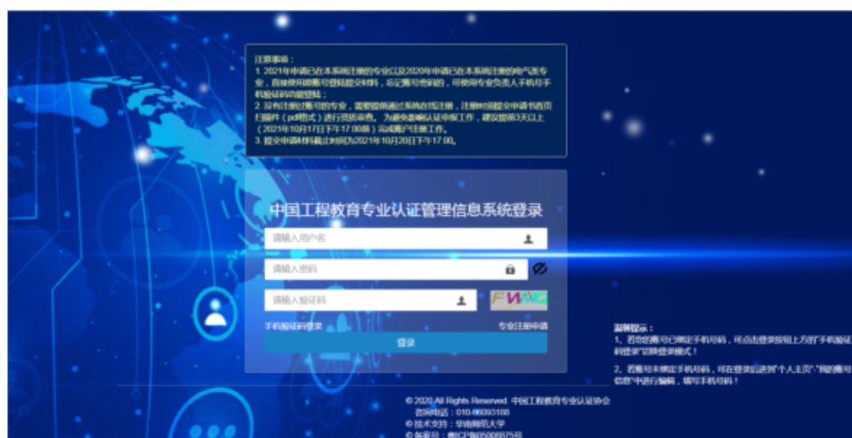
图 1 系统登录界面

请登录“工程教育专业认证管理信息系统” http://gcrz.ceeaa.org.cn/ （如图 1 所示）。