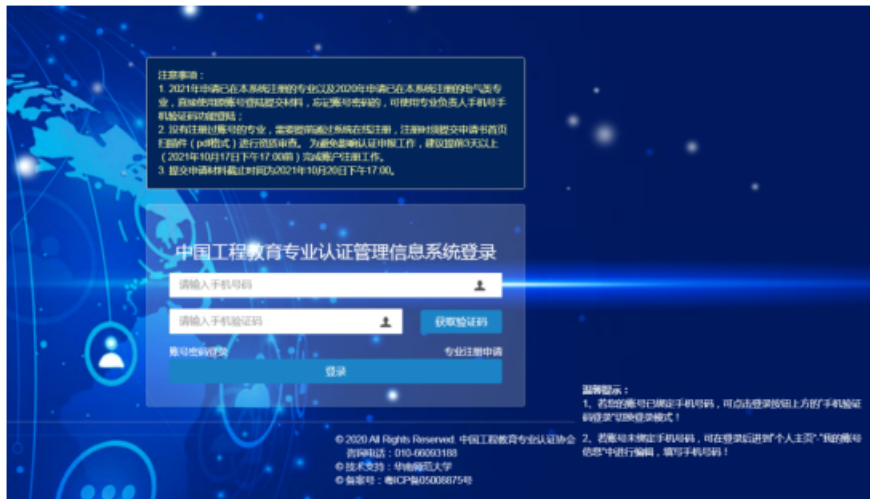
图 2“手机验证码登录”登录界面