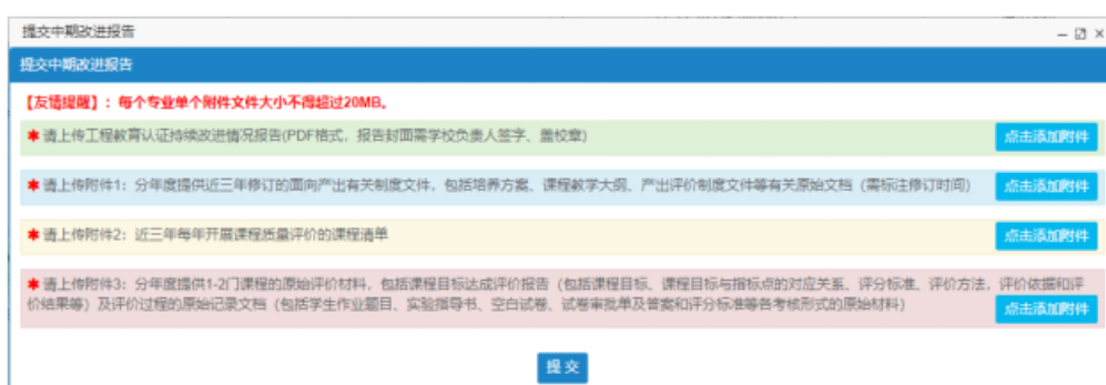
图 5 “提交持续改进情况报告”界面

原始材料文档如超过 20M, 建议将原始材料与年度报备材料共同存放于本地服务器或网盘内, 同时建立一个含有链接地址和文件目录的 word 文档, 按实际内容命名后上传至附件 3 位置。